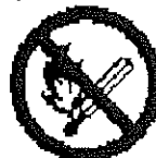
Pas de flammes