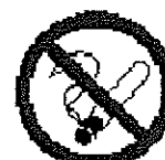
Interdit de fumer